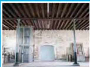
Construire des bâtiments industriels

Le titulaire du BTS Bâtiment est amené à exercer son métier dans les domaines du gros-œuvre du bâtiment.