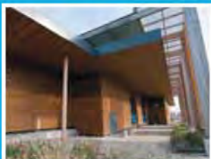
... des bâtiments commerciaux ou de loisirs