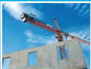
... des bâtiments publics ou privés