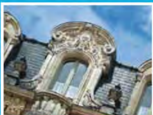
Réhabiliter d'anciens bâtiments