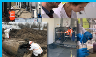
La dépollution des sites

Le titulaire du Brevet de Technicien Supérieur Métiers des Services à l'Environnement est un professionnel qui exerce ses activités dans les secteurs de :