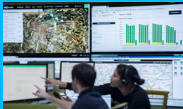
La collecte et la valorisation des déchets