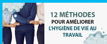
La propreté et l'hygiène